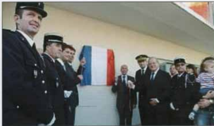
La plaque comportant le nom du centre a été dévoilée hier après-midi.